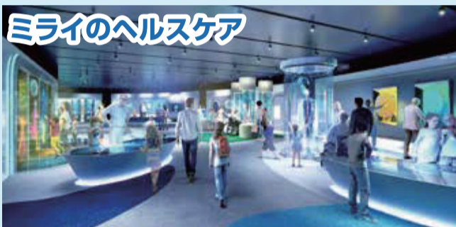
健康データから栄養・身体・心に関する様々なミライのヘルスケア体験を提供。