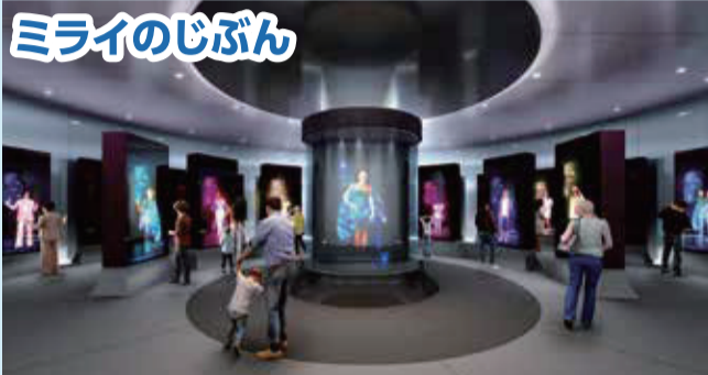
健康データをもとに映し出される25年後の自分(アバター)とともに、ミライのヘルスケアなどを体験。