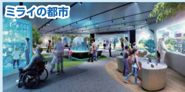
2050年頃に実現が想定される「ミライの都市」へ生まれ変わった「ミライのじぶん」で参加。