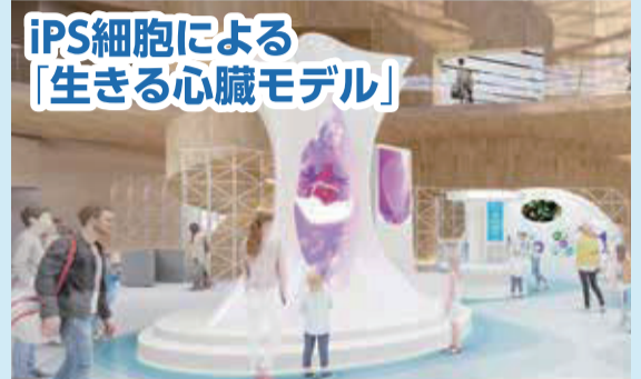
大阪・関西の再生医療のポテンシャルと未来を示すため、iPS細胞による心筋シートや「生きる心臓モデル」を展示。