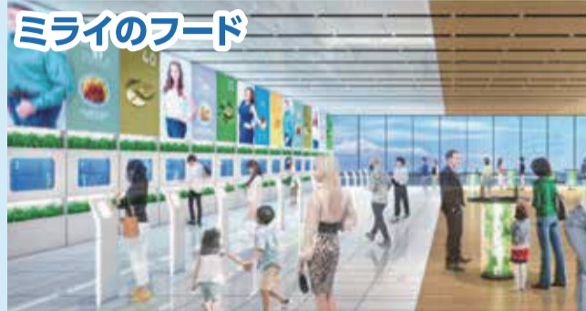
健康データから食に関するアドバイスを行うとともに、身体によく美味しいミライのヘルスケアフードを提供。