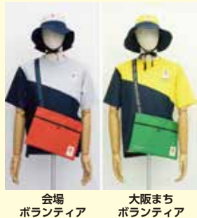
会場ボランティア 大阪まちボランティア