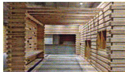
2021年度府立中央図書館内装の木質化

2021~2023年度で府有施設(ロビー、図書館など)で内装木質化や木製什器を導入