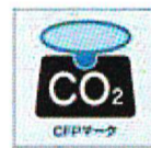
一般的なCFPラベリングのイメージ

生産・流通等に伴い発生するCO2を見える化する「カーボンフットプリント(CFP)」の算定手法及びそれを活用したパッケージへの表示(CFPラベリング)などによる普及啓発手法を検討