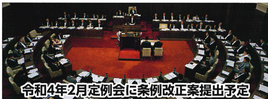
令和4年2月定例会に条例改正案提出予定

※1. 本会議では一般質問と会派の代表が行う代表質問がある。 ※2. 委員長(8人)は委員会運営に専念するため質問はしていない。 ※3. 議員は8つある常任委員会のいずれか一つに所属することになっている。