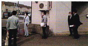
歩車分離信号機設置付近

府議会でも質問したが、改めて現地を視察。私部6丁目20付近の押ボタン信号機の設置は見送られたが、交野市郵便局前の交差点は「歩車分離信号機」に変更されることとなる。残る横断歩道の整備等は、関係者が合意し決定した通学路を示した上で、速やかに調査、施工すべく引き続き働きかけていく。