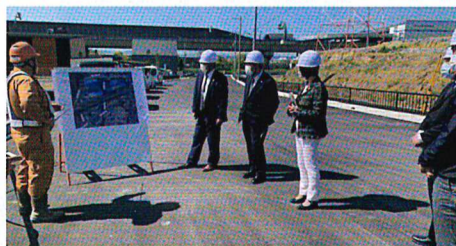
信号機設置場所付近で区画整理事業の視察

星田駅前線整備に伴う国道1号との新設交差点の信号設置について、大阪府警は、令和2年度中に当該設置事業を予算計上したが、国道事務所の担当者の変更等により施工協議に時間を要し、同年度中の工事着手が困難となったため、星田北土地区画整理組合の負担により設置も含めて検討するように言われていた。関係者から事情を聞き、大阪府警に事実確認の上、令和3年度予算への繰り越しを要望したところ認められ、令和3年度の事業として実施されることとなり、組合の皆様の負担はなくなった。