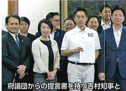
府議団からの提言書を持つ吉村知事と