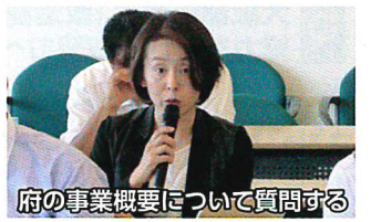
府の事業概要について質問する

府が推進する事業には、府民の貴重な税金が投入されています。今後の大阪のために選択と集中によって進めていけるよう取り組みます。