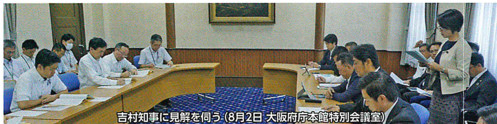
吉村知事に見解を伺う(8月2日 大阪府庁本館特別会議室)