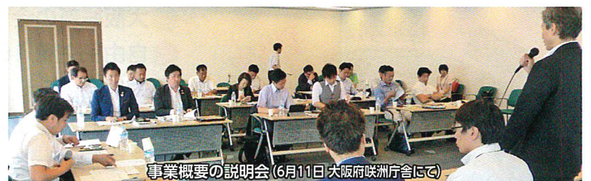
事業概要の説明会(6月11日 大阪府咲洲庁舎にて)